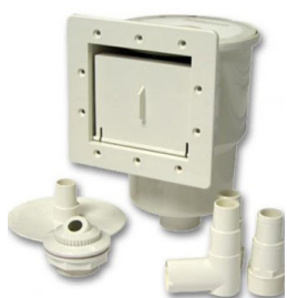
Skimmer et refoulement