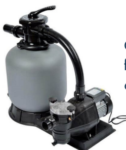
Groupe de filtration à sable 6 ou 10 m 3 /h