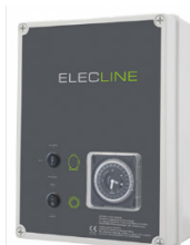
Coffret de filtration